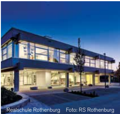
Realschule Rothenburg