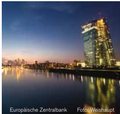
Europäische Zentralbank