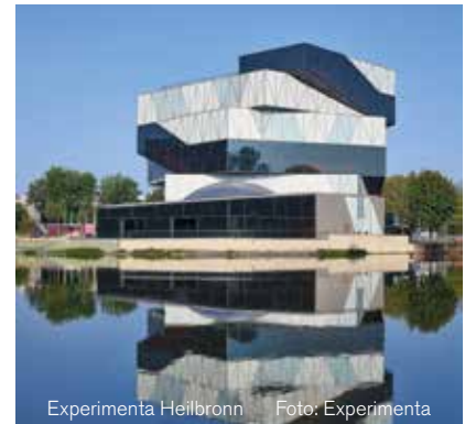
Experimenta Heilbronn

Neuberger steht für Projektierung, Planung, Entwicklung von Hard- und Software, Programmierung, Fertigung, Wartung und Service - alles kommt bei uns aus einer Hand.